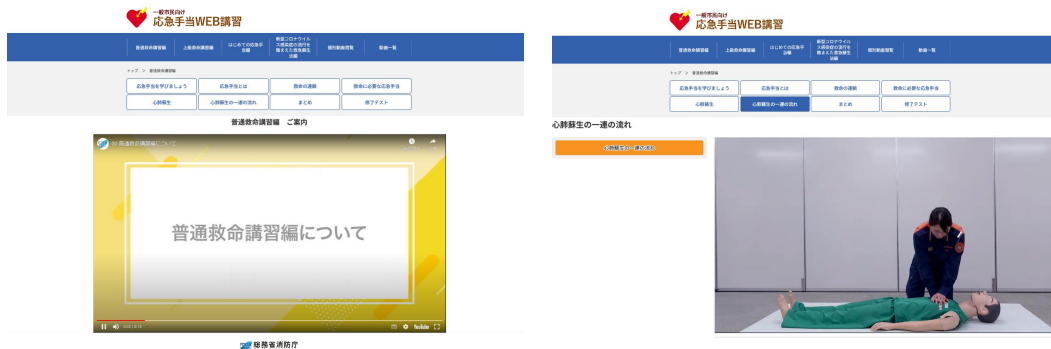
普通救命講習編 開始画面

※各カテゴリや各動画は、別途選択なくとも、順に自動で再生されますが、個別に選択して、任意の順で視聴することも可能です。(全ての動画に「終了」の印が付されていれば問題なし。)